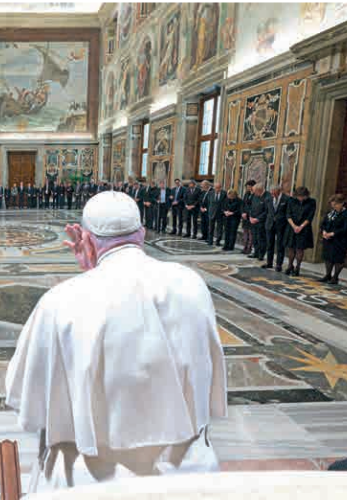
Plus de cent invités ont été accueillis personnellement par le Saint-Père dans la Salle Clémentine du Palais Apostolique.

Die über hundert Gäste wurden vom Heiligen Vater in der Sala Clementina des Apostolischen Palastes persönlich begrüsst.